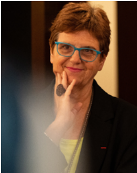
↑ Yannick Lintz

En cette année de célébrations du 60 e anniversaire des relations diplomatiques entre la France et la Chine, les Français découvrent – ou redécouvrent – l’art d’un pays au riche patrimoine culturel.