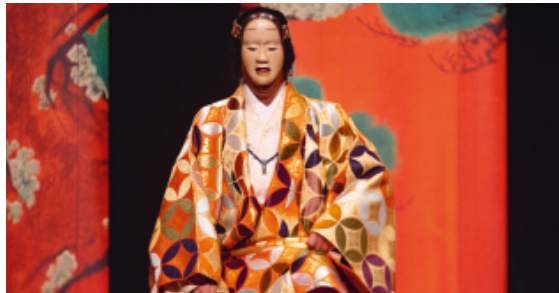
↑ © Julien Jovelin

18€ - Billetterie en ligne et sur place Gratuité le jour même selon conditions et dans la limite des places disponibles.