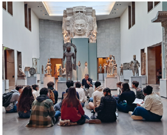
↑ © Nicolas Ruyssen

Danse, musique classique et contemporaine, littérature mais aussi jeux de rôles, visites commentées des expositions adaptées à tous les publics, journées d'étude et ateliers créatifs, chaque visiteur pourra trouver au musée Guimet de quoi satisfaire sa curiosité et sa soif de découverte.