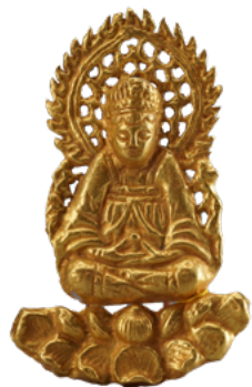
↑ Ornement en forme de saint personnage. Dynastie Ming (1368-1644), or, Xi'an, musée des Beaux-Arts de Qujiang

L'exposition propose un parcours de visite destiné au jeune public (8-12 ans).